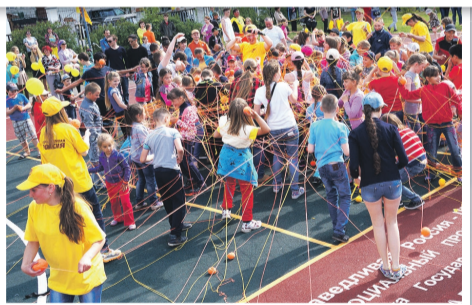
Во время игры с нитками градус настроения зашкаливал