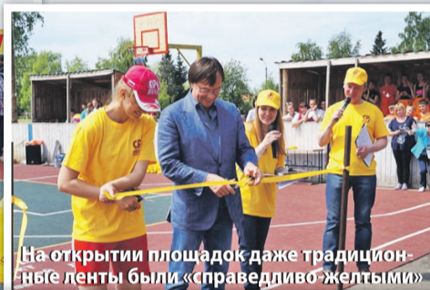
На открытии площадок даже традиционные ленты были «справедливо-желтыми»