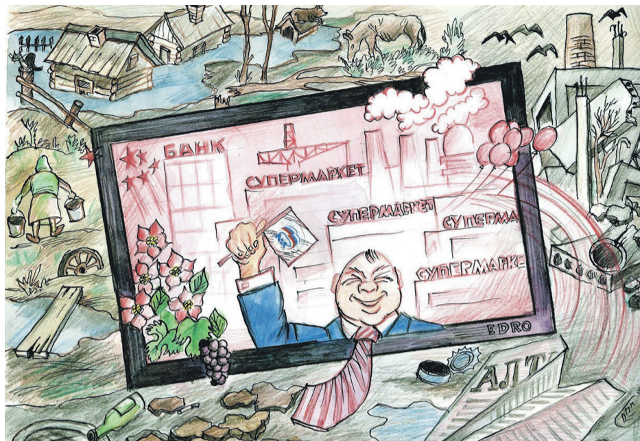
Картинка из телевизора все больше расходится с реальностью

Первая — уровень зарплаты в регионе. Именно эта цифра является основным показателем реального экономического развития. Ведь это развитие важно нам не какими-то абстрактными индексами или коэффициентами, а количеством тех благ — еды, одежды, лекарств, бытовой техники и многого другого, которые конкретный человек может себе позволить приобрести. Так вот, по этому показателю у нас все очень плохо. Если десятилетие назад Алтайский край за-