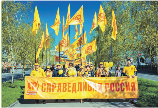
На фото – колонна СПРАВЕДЛИВОЙ РОССИИ на первомайской демонстрации в Барнауле

Вопреки ожиданиям, проведенное предварительное голосование – праймериз привело к еще большему ослаблению партии. Причиной тому – многочисленные скандалы, связанные с административным ресурсом, обиды многих участников, которые почувствовали себя обманутыми. Но, самое главное, оно не ответило на главный запрос жителей края – обновление власти. Состав людей, которые ЕР поведет на выборы, – либо действующие депутаты, либо работники краевых структур. Как говорится, «на манеже – все те же». Все это