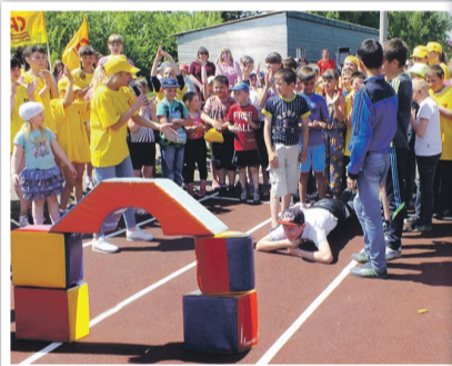
Хабарские ребята охотно заезжали на скейте в импровизированные «хоккейные» ворота» на новой беговой дорожке