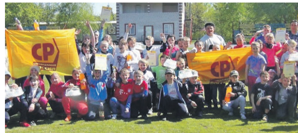
«Веселые старты» в Родинском районе

Проведение некоторых соревнований пришлось в прямом смысле отстоять. Местные власти в Советском районе, ссылаясь на некую директиву сверху, пытались сорвать спортивный