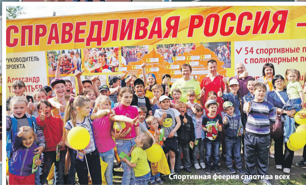
Спортивная феерия сплотила всех