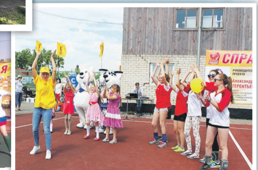
Завьяловским школьникам подбадривали спортивный дух пушистые друзья