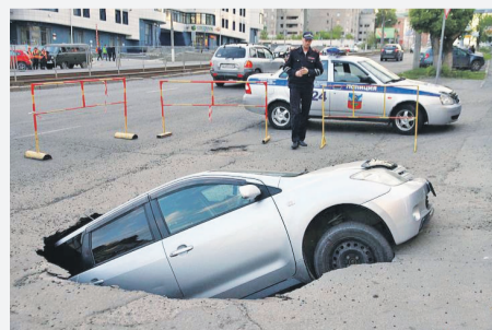
Целая череда чрезвычайных происшествий охватила краевой центр в мае. Первый звонок прозвенел, когда в самом

центре города на проспекте Социалистическом на голову прохожему отвалился кусок лепнины с дома. 54-летний мужчина в тяжелом состоянии был доставлен в больницу. Затем неприятности посыпались как из рога изобилия: 20 мая в ходе опрессовки произошло повреждение тепломагистрали на пересечении улиц Попова и Антона Петрова. В результате гигантский фонтан кипятка достиг окон 8–9-го этажей стоящего рядом дома. Вечером того же дня прямо в центре города ушел под землю автомобиль. Он стоял на парковке гостиницы «Турист» на проспек-