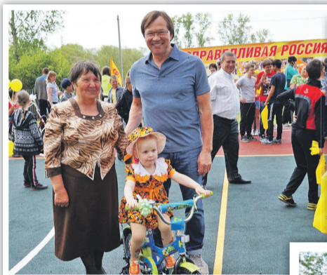
В Панкрушихе бабушка выиграла для внучки новенький велик, совершив 4 из 5 результативных броска в баскетбольное кольцо

В ближайшие дни спортивная площадка откроется в селе Бурла.