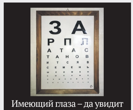
Имеющий глаза – да увидит

В связи со снижением доходов от выкачивания нефти правительство приняло креативное решение – выкачивать деньги прямо из карманов граждан.