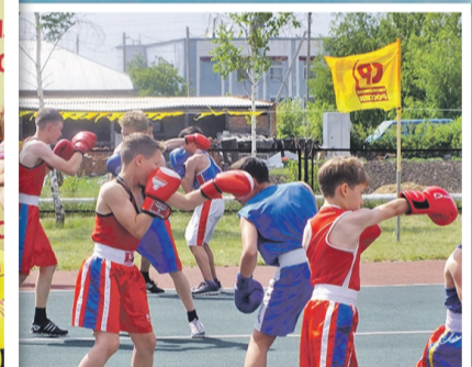
Юные боксеры Гальштадта удивляли красивыми ударами