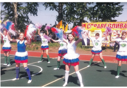
Более 500 жителей Михайловского наслаждались ярким спортивным шоу