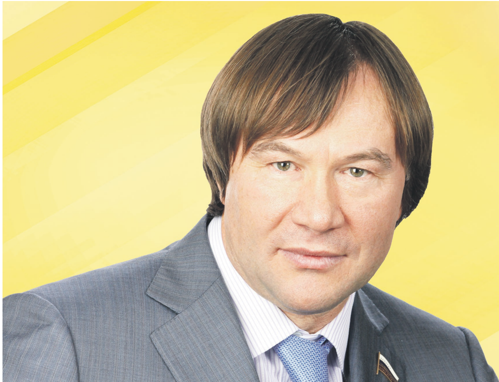
Александр Терентьев: Депутат Государственной Думы РФ