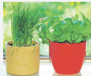
Огород круглый год стр. 7