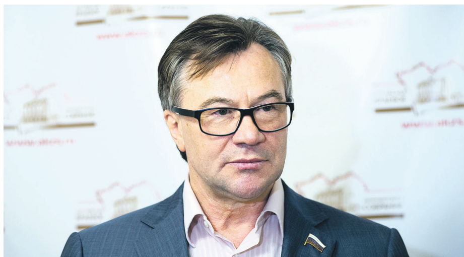
Представитель Алтайского края в Госдуме Александр Терентьев вместе с фракцией СПРАВЕДЛИВАЯ РОССИЯ стал одним из самых эффективных депутатов

Однако есть четыре законопроекта, которыми Госдума гордиться не может