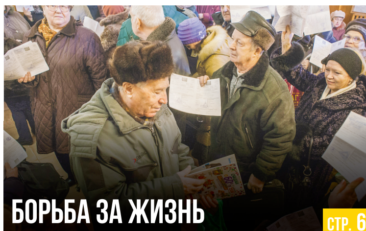
БОРЬБА ЗА ЖИЗНЬ