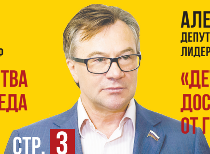
АЛЕКСАНДР ТЕРЕНТЬЕВ, ДЕПУТАТ ГОСДУМЫ РФ, ЛИДЕР АЛТАЙСКИХ СПРАВЕДЛИВОРОССОВ:

«ДЕТИ ВОЙНЫ» ЗАСЛУЖИЛИ ДОСТОЙНОЕ ПОЩРЕНИЕ ОТ ГОСУДАРСТВА