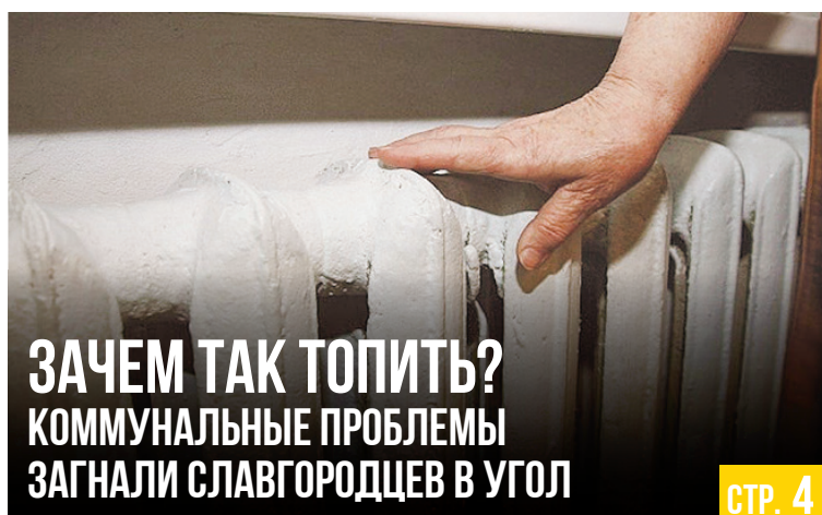
ЗАЧЕМ ТАК ТОПИТЬ? КОММУНАЛЬНЫЕ ПРОБЛЕМЫ ЗАГНАЛИ СЛАВГОРОДЦЕВ В УГОЛ