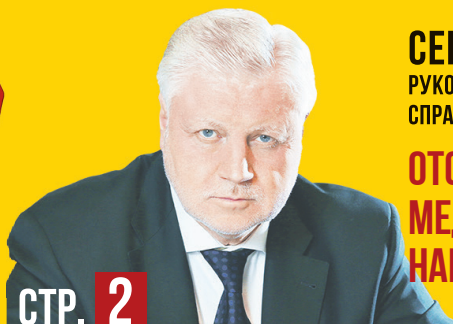
СЕРГЕЙ МИРОНОВ, РУКОВОДИТЕЛЬ ФРАКЦИИ СПРАВЕДЛИВАЯ РОССИЯ В ГОСДУМЕ РФ

ОТСТАВКА ПРАВИТЕЛЬСТВА МЕДВЕДЕВА – ЭТО ПОБЕДА НАШЕЙ ПАРТИИ