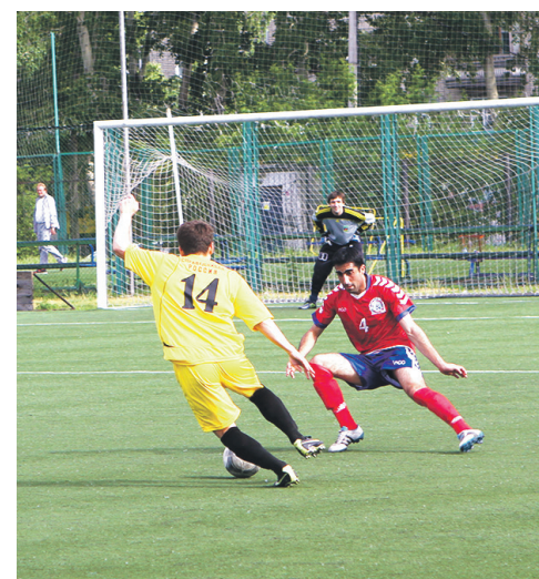
Депутат Госдумы, лидер алтайского регионального отделения Александр Терентьев встретился с футболистами и поздравил их с успехом.

Очередного успеха добилась футбольная команда регионального отделения партии СПРАВЕДЛИВАЯ РОССИЯ в Алтайском крае.