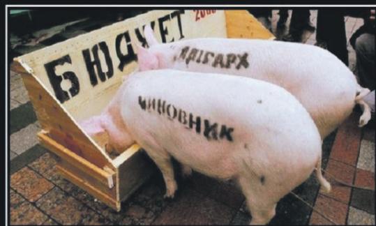
Российская экономическая система

Минздрав РФ предупреждает: Минфин – козлы.