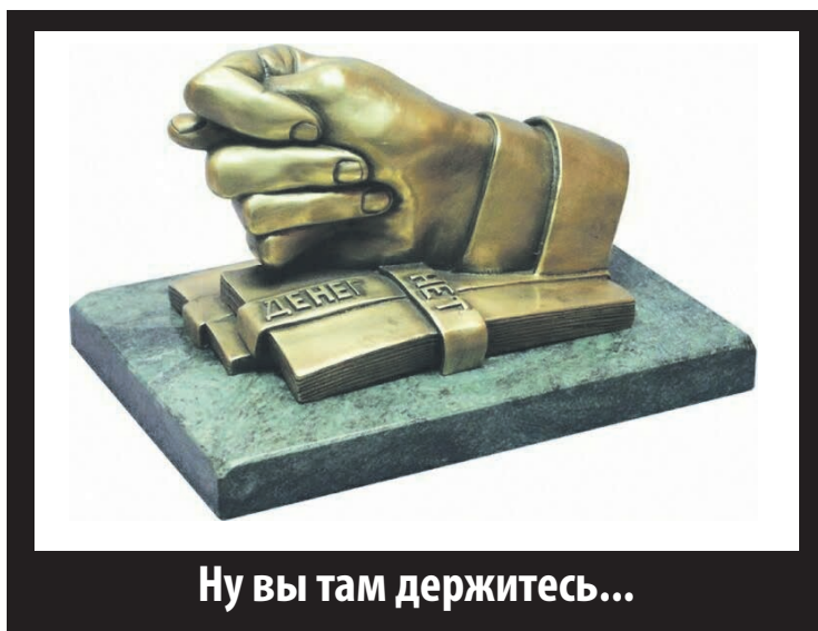
Ну вы там держитесь...

Раньше для его получения, наряду со стажем, нужно было получить краевую или муниципальную награду (грамоту). Теперь же – только краевую. Благодарности от муниципальных органов власти будет недостаточно. Нужно отметить, что